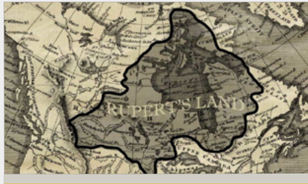
Rupertsland Institute, Métis Centre of Excellence www.rupertsland.org/metis-homeland/

Après 1821, la baisse d'activité entourant le commerce des fourrures pousse certains Métis à se tourner vers la chasse au bison. Ils fournissent ainsi des peaux de bison et du pemmican à la Compagnie de la Baie d'Hudson, ce qui leur permet de développer des compétences