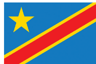
République démocratique du Congo